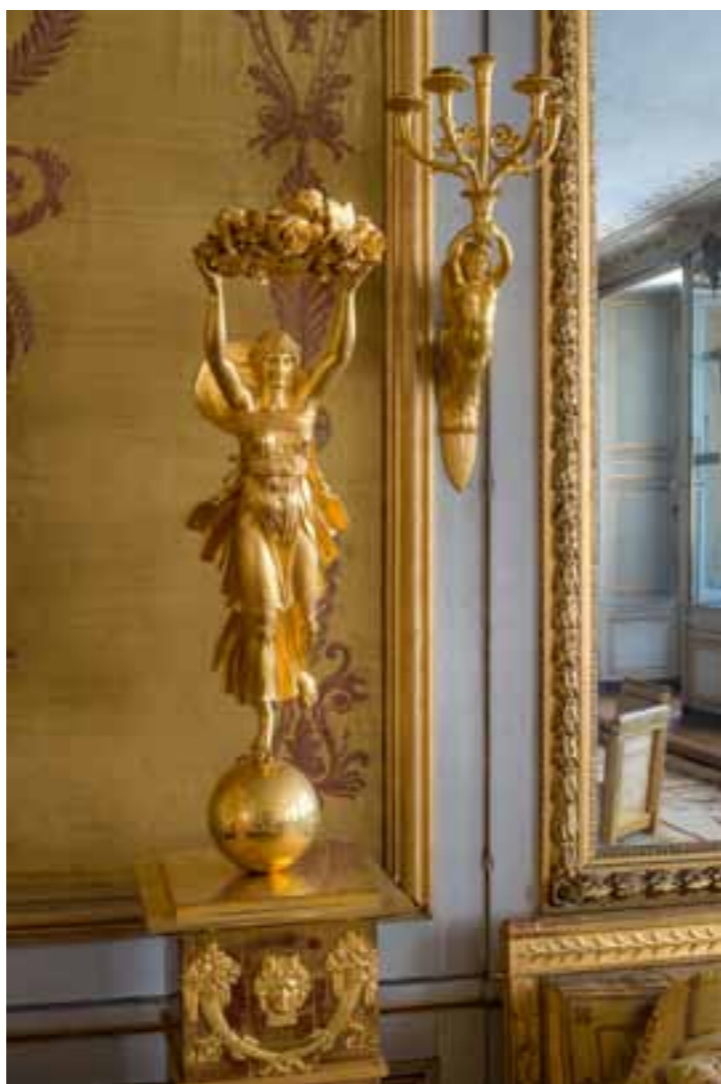
« La beauté selon l'empereur ne réside que dans la grandeur ». PIERRE-FRANÇOIS LÉONARD FONTAINE